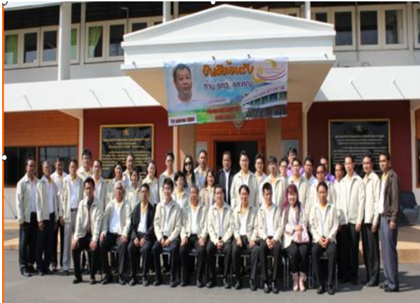
รูปที่สมบูรณ์